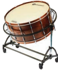
La grosse caisse