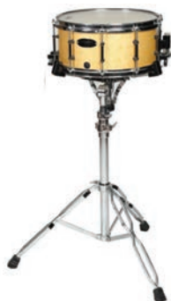
La caisse claire